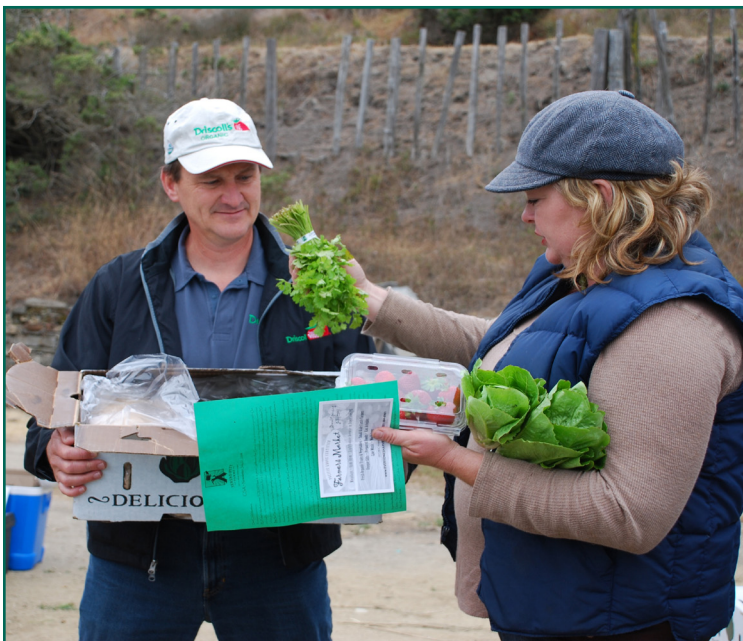
Serendipity Farm.