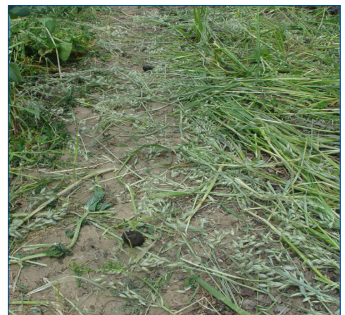
Estiércol de oveja en un cultivo de cobertura en nogales. Este agricultor sacó a las ovejas del huerto de nogales debido al riesgo potencial (y responsabilidad) de contaminación de nueces durante la cosecha con patógenos de estiércol sin descomponer.