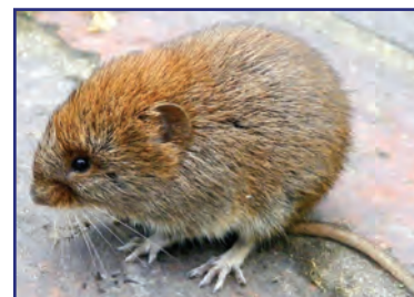
Ratón de Campo.