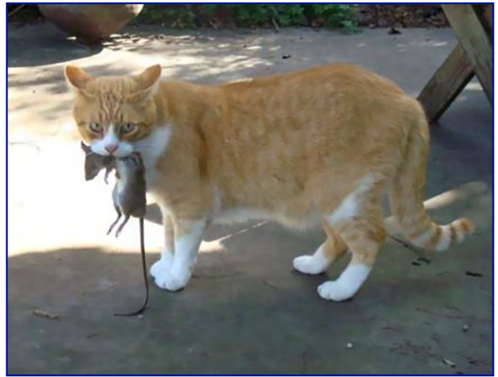
Los gatos domésticos pueden ayudar a mantener bajas las poblaciones de ratas y ratones. Tenga en cuenta que los gatos, especialmente los gatos asilvestrados, pueden aprovecharse de organismos no objetivo (aves, lagartos), incluidas las especies en peligro de extinción.

Depredadores y Controles Naturales. Dependiendo de la vida silvestre que vive en su región, muchos tipos de depredadores pueden ayudar a reducir las poblaciones de roedores. Una población sana de depredadores naturales puede incluir gatos monteses, zorros, coyotes, tejones, zorrillos, comadreas, serpientes, búhos, cuervos, halcones y la mayoría de las demás rapaces de gran tamaño. La depredación representa una gran proporción de mortalidad de roedores, aunque no controlará completamente a una población. Sin embargo, vale la pena fomentar la depredación, especialmente mediante el uso de plataformas de raptor (halcón y búho), nidales y perchas en toda la granja. La investigación ha demostrado que atrayendo aves rapaces a áreas agrícolas, el uso de pesticidas disminuye (Lindell et al., 2018; Novak and Torfeh, 2017). El Servicio de Conservación de los Recursos Naturales (NRCS, por sus siglas en inglés) tiene fondos para ayudar a los agricultores a instalar estructuras para vida silvestre en sus tierras, así como a fondos para muchas otras prácticas de conservación. Su centro de servicio local de USDA puede ubicarse en https://offices.sc.egov.usda.gov/locator/app .