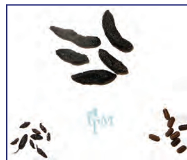
Clockwise from the top are Norway rat, American cockroach, and mouse droppings.

Colocando un polvo fino como el talco a lo largo de caminos sospechosos debería dejar huellas. Si las impresiones son de ½ pulgada con 4 o 5 dedos, es una rata, más pequeña que eso, sería ratón casero si está adentro y ratón de campo si está afuera. Los ratones de campo hacen senderos conectando madrigueras y áreas en las que se alimentan.